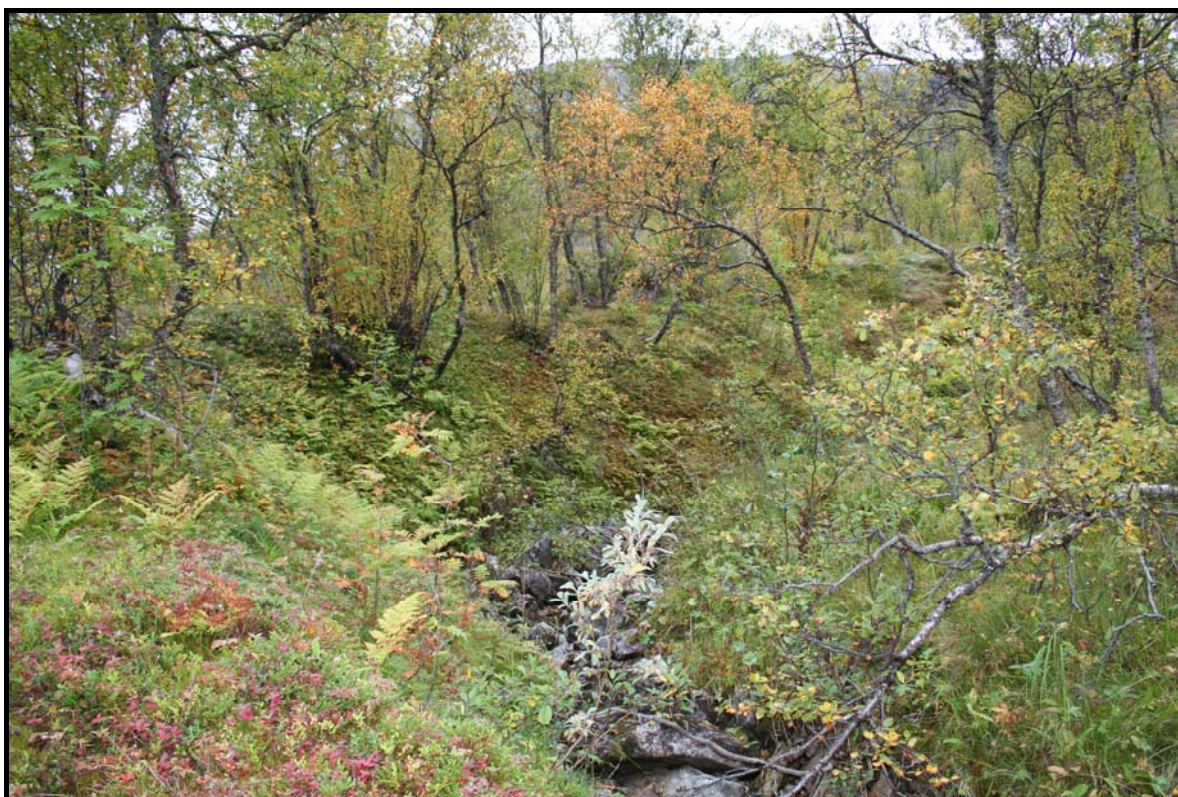
Figur 8: Motiv fra den grunne ravine/bekkekløfta som er gravet ut i morenen i sørenden av planområdet.

Utrasninger i brerandavsetningen og direkte forurensning og forsøpling under anleggsfasen må generelt unngås. Ny tilplantning av blottlagte områder vil kunne redusere erosjon i bratte eller vindutsatte sider. Likeledes bør man unngå utgraving av bekkeravinen som går gjennom området i sørenden av planområdet (se figur 2 og 8). Tilplantning bør i størst mulig grad foregå med lokalt tilpassete arter. Ikke-hjemlige arter som kan komme til å etablere seg, bør i størst mulig grad unngås. I forbindelse med etterfølgende detaljprosjektering, forutsettes at naturmiljøet blir tatt hensyn til. Blant annet bør slik kompetanse rådspørres ved valg av løsninger for kryssing av bekker og myrer. Likeledes forutsettes det at naturmiljøet blir tatt hensyn til i anleggsfasen.