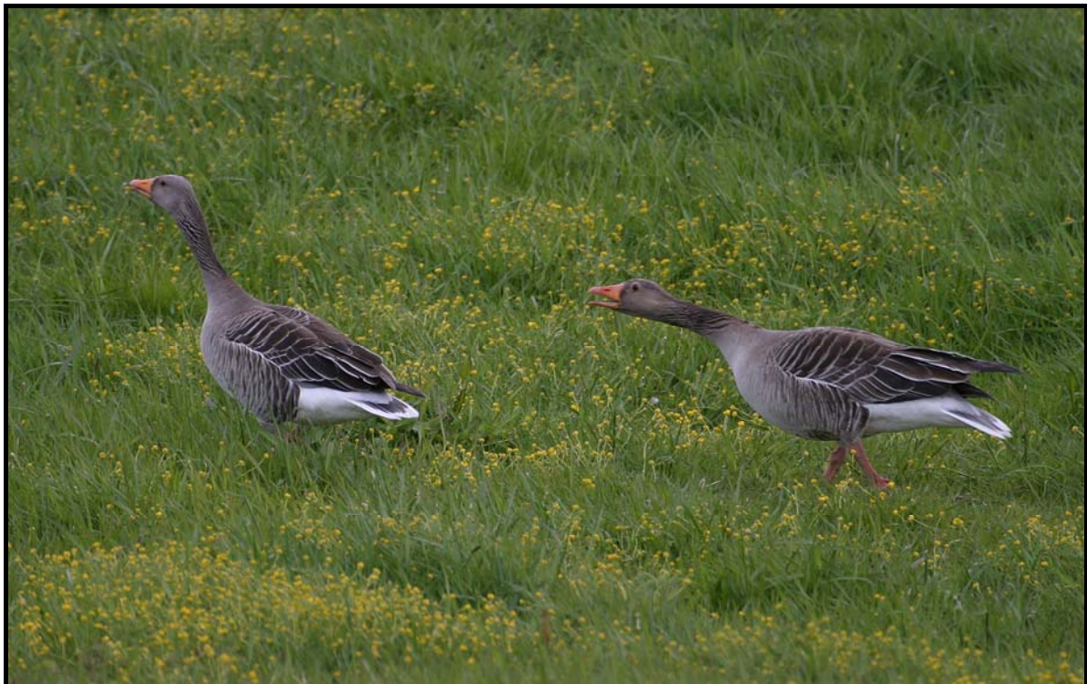
Figur 6: Mytefjær og eksekrementer fra grågås ble funnet nede ved sjøen på Åborsnes, og det er mulig at arten også kan hekke her.

Samlet vurderes omfanget til stort negativt. Men på grunn av liten verdi vil tiltaket kun ha liten negativ konsekvens på det samlede naturmiljøet (figur 7).