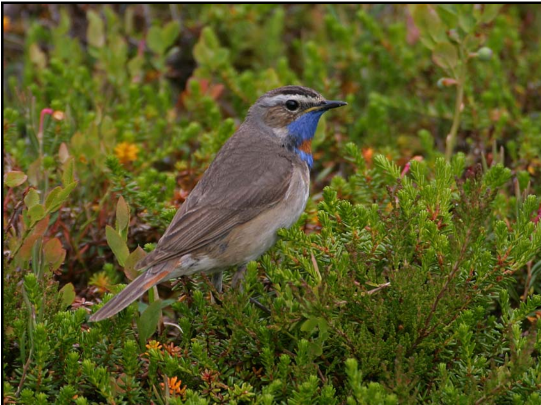
Figur 5: Blåstrupe er vanlig i fuktige partier i planområdet.

Vi vurderer den samlede naturverdien av hele planområdet til å være liten (lokal) verdi , og denne verdien brukes i konsekvensanalysefiguren (figur 7).