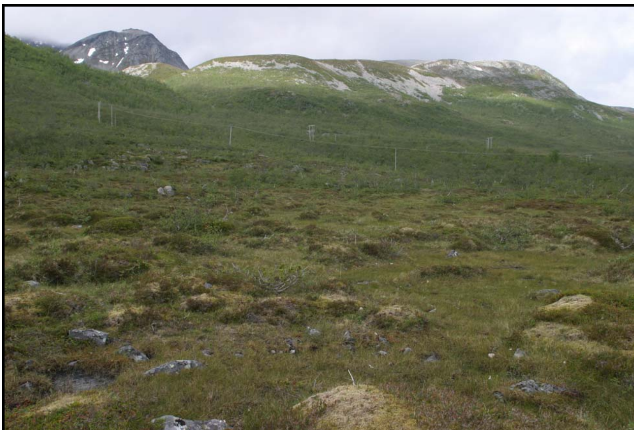
Figur 4: Parti fra den treløse delen i nordenden av planområdet.