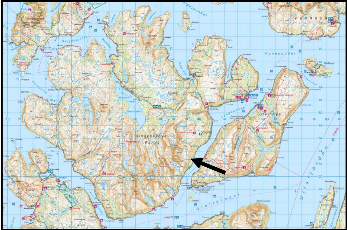
Figur 1: Oversikt over regionen. Det planlagte industriområdet ved Åborsnes er vist med pil.