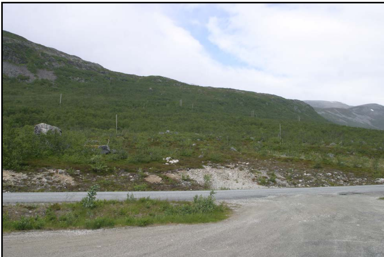
Figur 3: Motiv fra den sørlige delen av planområdet.